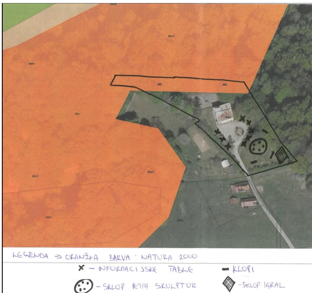
Slika 1: Območje okoli stare karavle v Ceršaku

Lokacija operacije na območju Občine Šentilj je na parc. št. 1552/11 in 385 k. o. 563 – CERŠAK.